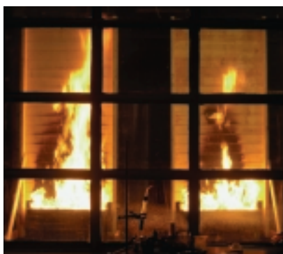
Testing av brannimpregnert kledning ved tilført varme nedenfra.

Brannbeskyttede treprodukter har blitt testet etter samme standard som andre materialer i NS 3919 Brannteknisk klassifi-