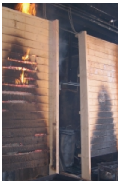
Brannimpregnert tre var selvslukkende, mens den ubehandlede kledningen til venstre underholdt brannen etter at den eksterne flammen var fjernet.

sering av materialer, bygningsdeler, kledninger og overflater. Denne standarden definerer blant annet klassene K1, In1 og Ut1.