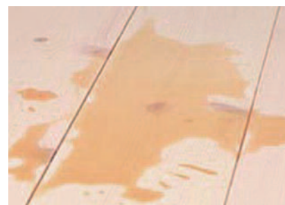
Såpevasking av gulv.

Dersom gulvet brukes slik at man må skure kraftig og ofte, bør man heller bruke en behandling som gir beskyttelse, ellers vil treet ha en tendens til å bli oppfliset med tiden.